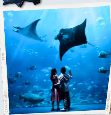
ZONE 7 : FAR FAR AWAY