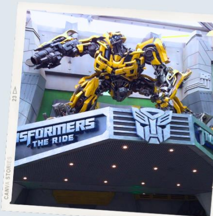
ZONE 1 : HOLLYWOOD