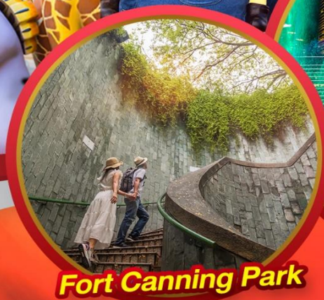
Fort Canning Park