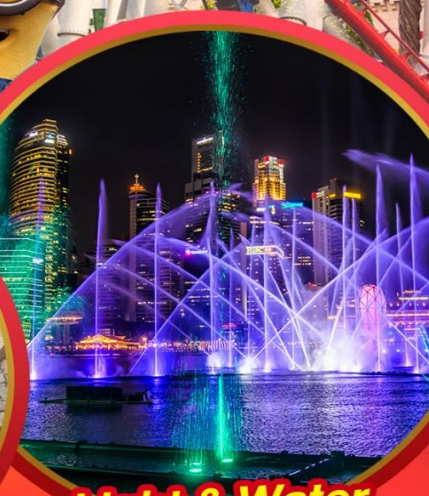
Light & Water Show