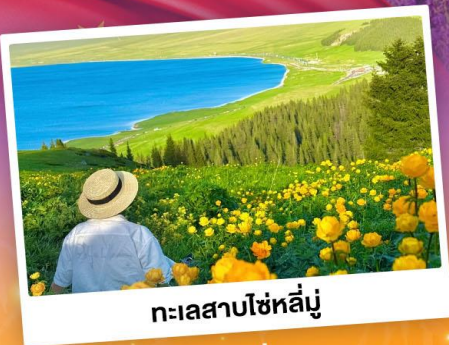
ทะเลสาบโซห์ลี่มู่

ถ่ายรูปทุ่งดอกลาเวนเดอร์ - กุ่งหญ้าคาลาจุ่น SKY GRASSLAND กุ่งหญ้ามรดกโลก