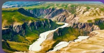
แกรนด์แคนยอนคูซานจื่อ