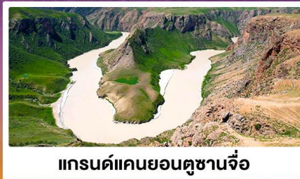
แกรนด์แคนยอนตูซานจื่อ