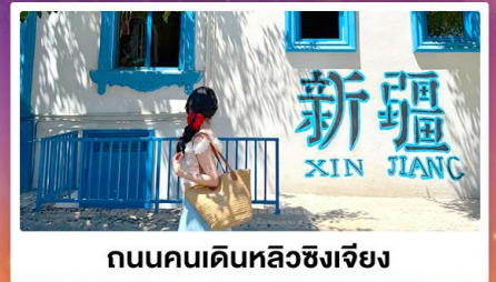
ถนนคนเดินหลิวซิงเจียง