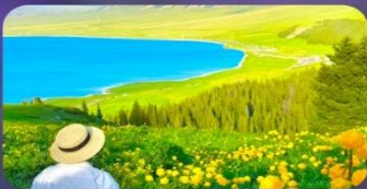
ทะเลสาบไซไห่หลี่มู่