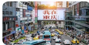
ถนนอาหารกวนอันเฉียว