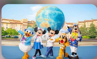
อิสระตามอริยาคัย 2 วัน