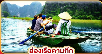
ล่องเรือตามก๊ิก